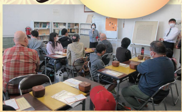
前回の入門教室の様子

主催 名峰と名水の里北杜市囲碁まつり実行委員会 / 北杜市 / 北杜市教育委員会