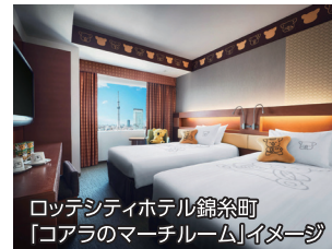
ロッテシティホテル錦糸町 「コアラのマーチルーム」イースト

昨年は ロッテシティホテル 錦糸町ペア宿泊券、 ロッテのお菓子 詰め合わせセット、 小学館・幻冬舎から 書籍やゲーム等、 素敵なグッズが登場。