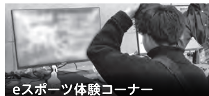
eスポーツ体験コーナー