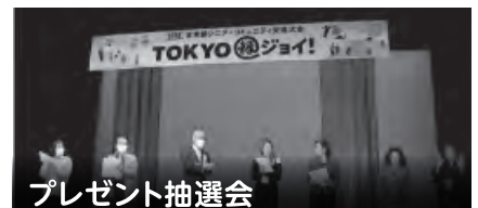
プレゼント抽選会