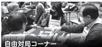
自由対局コーナー