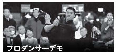
プロダンサーデモ