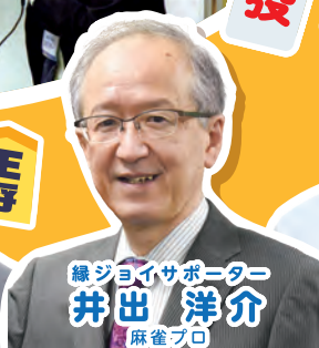
緑ジョイサポーター 井出 洋介 麻雀プロ