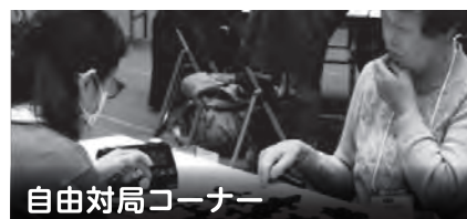
自由対局コーナー