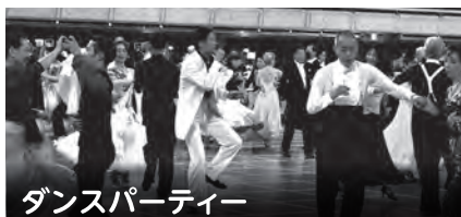
ダンスパーティー