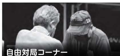
自由対局コーナー