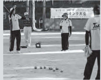
ペタンク競技イメージ

フランス発祥のボールゲーム。決められた位置からボールを投げ、目標の位置に近いボールの数を競います。シンプルなルールと戦略性の高さが魅力のスポーツです。