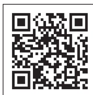
カラオケ・囲碁・ 将棋・健康マーチン