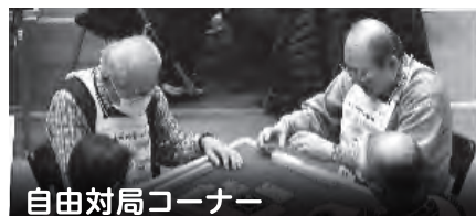
自由対局コーナー