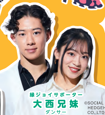
緑ジョイサポーター 大西兄妹 ダンサー