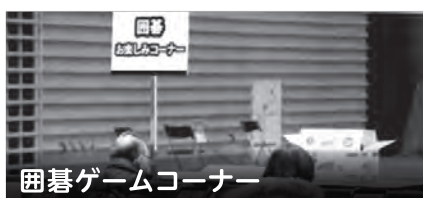
囲碁ゲームコーナー