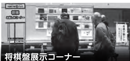
将棋盤展示コーナー