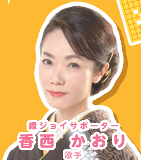
緑ジョイサポーター 香西 かおり 歌手