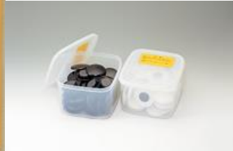
(解説用紙製 7 路盤とマグネット基石)